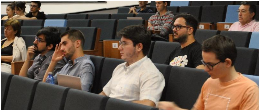
Grupo de doctorandos del Programa de Doctorado en Filosofía (US).